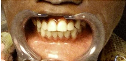
Fig 1 : limite d'ouverture buccale

L'examen endo-buccal ne peut se faire de manière complète pour cause de limitation de l'ouverture buccale.