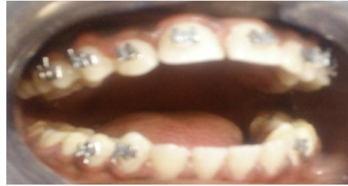
Fig 4 : Résultat intrabuccal

Le traitement a duré 2 mois durant lesquels, les élastiques ont été changés toutes les 2 semaines.