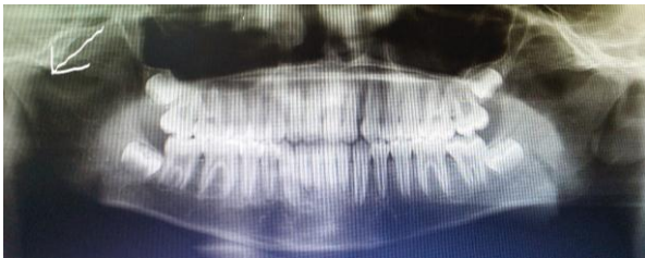
Fig 2 : radiographie panoramique pré opératoire

L'examen radiologique révèle une fracture condylienne gauche.