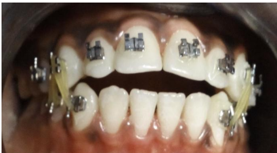
Fig 3 : Méthode de blocage

La contention s'est faite par des élastiques inter-maxillaires de 3 mm de diamètre avec comme ancrage, les canines au maxillaire et le couple canine-prémolaire à la mandibule.