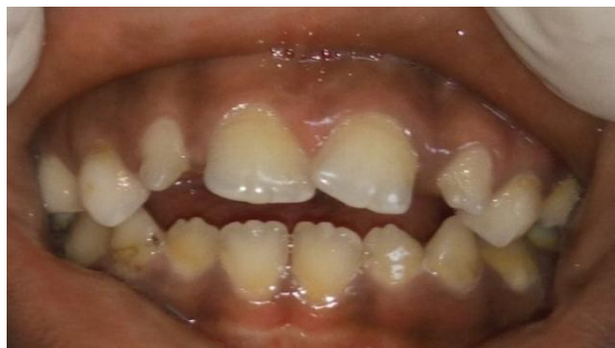
Fig. 2 : Microdontie de 52-62 + Présence de tartre sur les dents chez une fille de neuf ans porteuse de SD