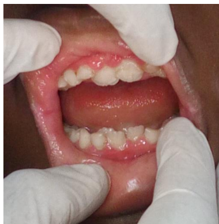
Fig.3: Gingivite + malposition dentaire chez un garçon de neuf ans porteur de SD