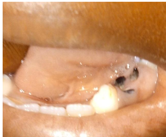
Fig. 5: Lésion carieuse de la 74 chez un garçon de sept ans porteur de SD